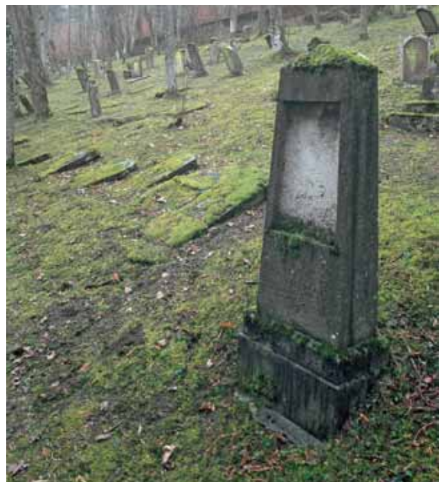
Hechingen, Jüdischer Friedhof.

handelt. 1714 wurde es als Stadtpalais für einen ehemals hessischen General errichtet. Der Architekt ist unbekannt, der französische Einfluss aber unbestreitbar, etwa durch die Disposition des Corps de logis als „entre-cour-et-jardin“, also zwischen Hof und Garten. Aus diesem paradiesischen Wohnbereich wurde 1760 dann aber eine Cotton-Manufaktur. Als man diese wegen der übermächtigen englischen Konkurrenz einstellte, wurde aus der Manufaktur eine landwirtschaftliche Hochschule. Der Garten diente nun als Lehr- und Versuchsbereich. Als 1818 das „Cameralgebäude