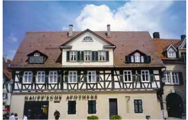
Lukarnen verschiedener Größe am Marktplatz in Schorndorf.