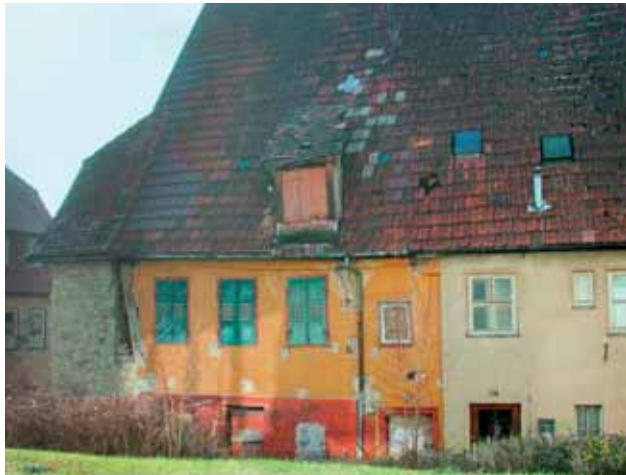
Nürtingen, Wohnhaus Strohstraße 15.