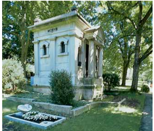
Göppingen, Grabkapelle Seefrid.

Das Palais beim Karlstor am Ende der Hauptstraße, nahe am Neckar, ist in vielerlei Hinsicht erstaunlich. Vor allem, weil es sich bei der Fülle von Nutzern und Nutzungen besonders innen um ein gut erhaltenes barockes Wunderwerk