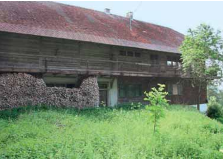
Seitenansicht des Schweizerhauses, das mit seinem weit heruntergezogenen Dach an einen Schwarzwaldhof erinnert.

1817 und 1854 amtierte und zusammen mit der badi-schen Prinzessin Amalie, seiner Ehefrau, das Schloss Heiligenberg wiederzubeleben begann. Dazu gehörte neben der Milchwirtschaft ein stattlicher Bauernhof, formal an bewährten Vorbildern aus der Umgebung orientiert: ein Schwarzwaldhof, viel Holz auf kräftigem Steinsockel und ein tief herabgezogenes, bergendes Dach, dazu umlaufende verzierte Laubengänge und ein weit vorgezogener Krüppelwalm, nach Schweizer Art sozusagen. Allerdings scheint die Bezeichnung „Schweizerhaus“ hier eher mit der damals aufkeimenden Alpenbegeisterung zusammenzuhängen als mit einer baugeschichtlichen Einordnung.