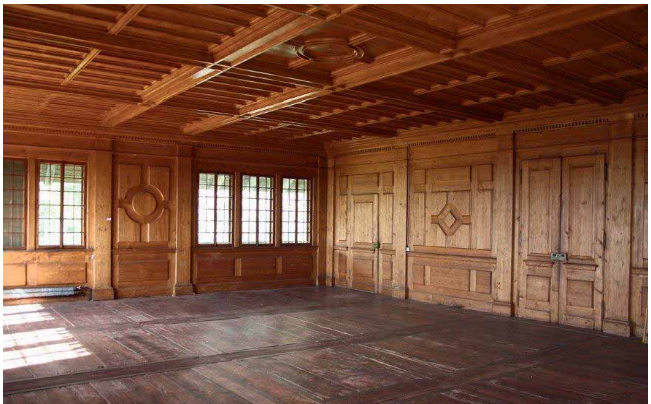
Prunkstück im Inneren ist der große, holzverkleidete Saal mit Kassettendecke.

Nun aber hinab vom Schloss, über das sich gewiss noch viel sagen ließe, zum Schweizerhaus, Gegenstand für das Engagement der Denkmalstiftung. Unterhalb des Schlossparks gelegen, wurde es 1832 als Sennerei gebaut – zur Versorgung der fürstenbergischen Familie droben, vor allem mit Milch. Bauherr war Fürst Karl Egon II. zu Fürstenberg, der zwischen