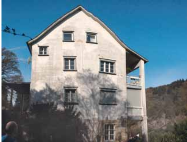
Heidelberg, Wohnhaus Hausackerweg.