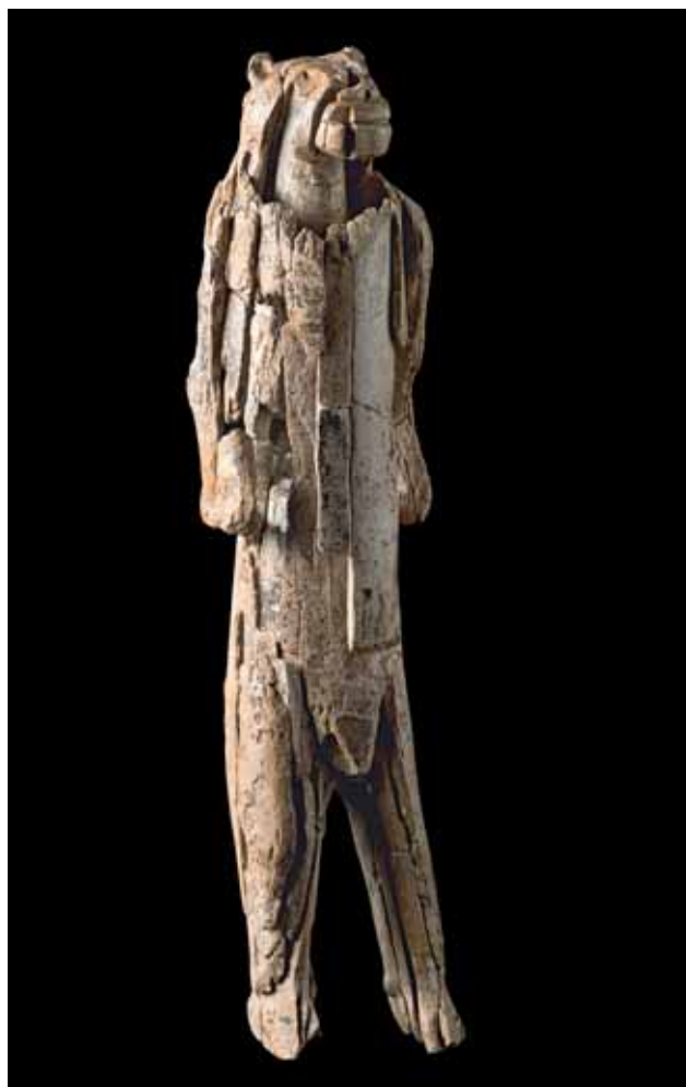
Der weltberühmte Löwenmensch (Ulmer Museum) aus dem Hohlenstein-Stadel im Lonetal ist ca. 30 cm hoch.

Kind: Die Landesregierung hat bereits Mittel zur Verfügung gestellt, um das touristische Informationssystem innerhalb der Täler zu verbessern. Damit sollen auch Installationen vor den Fundplätzen angebracht werden. Gedacht ist dabei unter anderem an digitale Informationssysteme, beispielsweise Apps oder