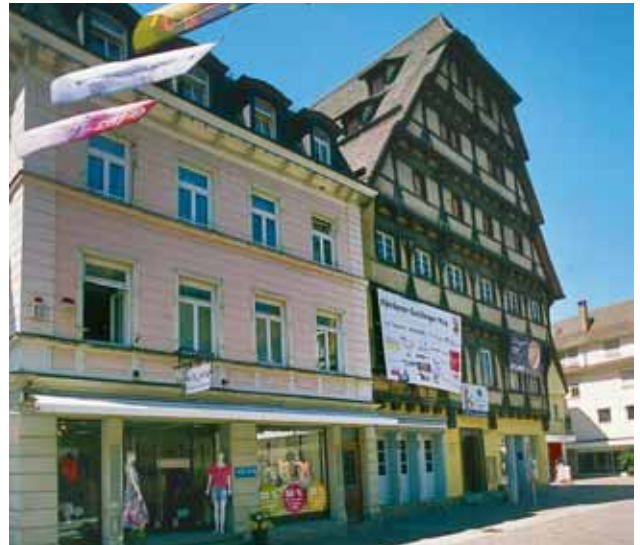
Geislingen, „Alter Zoll“.

Beim ersten Blick scheint es ein wohlhaltenes, typisches