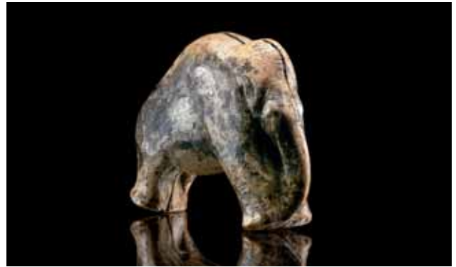
Die vollplastische Mammutfigur wurde bei Nachuntersuchungen des Abraummaterials am Vogelherd im Lonetal entdeckt.

Kind: Wesentlich ist, dass in diesen Talabschnitten, die