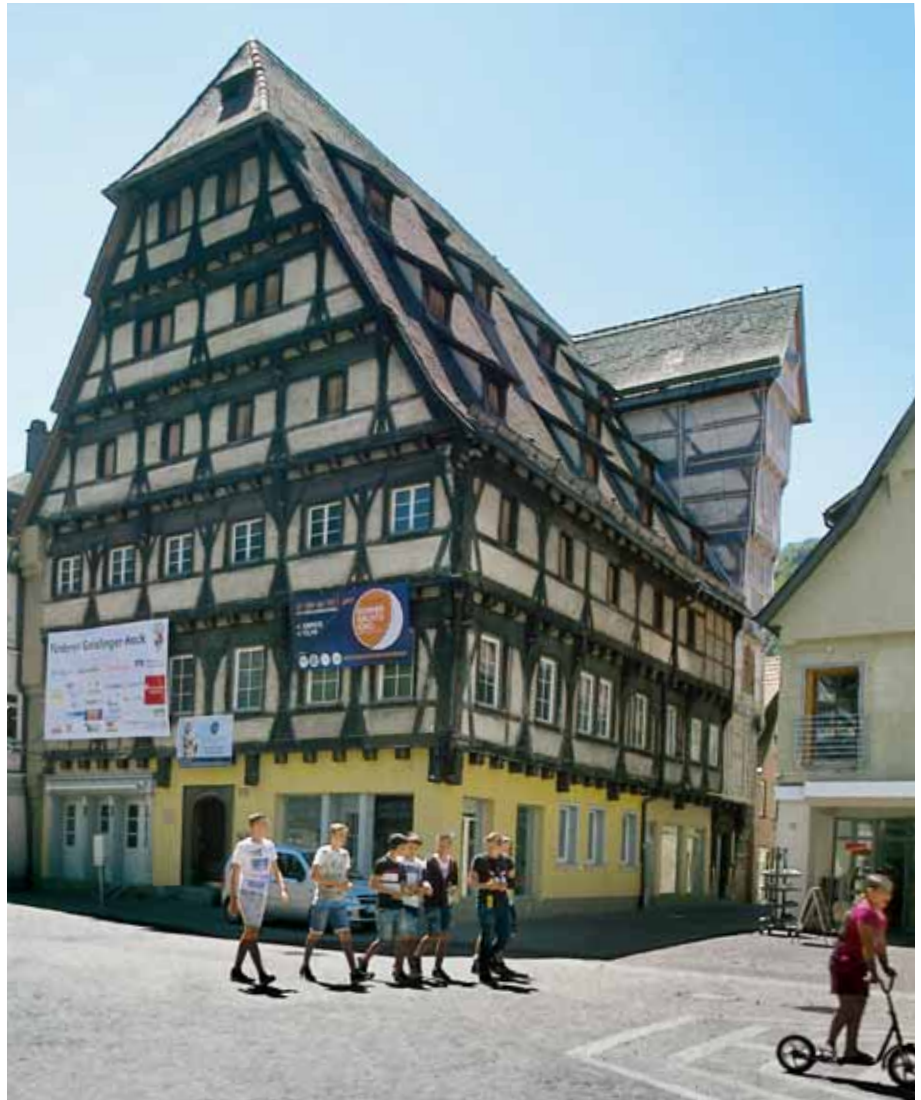
Der Alte Zoll in seiner ganzen Fachwerkpracht.

Die Schauffassaden des Alten Zoll stehen im Norden und Westen. Im Norden erhebt sich ein prachtvolles Fachwerk zur Hauptstraße hin. Das Erdgeschoss ist massiv gemauert. Hier unten wohnten einst die Zollbeamten. Darüber erheben sich fünf Fachwerkgeschosse. Danach wird die Giebelseite mit einem kleinen Krüppelwalm abgeschlossen.