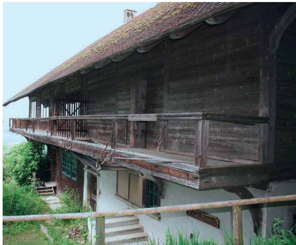
Markant sind die umlaufenden und verzierten Laubengänge des Schweizerhauses.

Jedenfalls scheint nun Dank des Engagements von Denkmalstiftung und GlücksSpirale die Zukunft des Gebäudes gesichert, sodass man es in Bälde auch ohne Taschenlampe besuchen und erkunden kann.