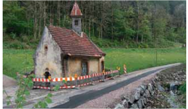
Wolfach, Hofkapelle, Langenbach 29.

Diese Darren im Bauland am Rand des Odenwalds haben einst mit ihrer gekonnten Art, Grünkern zu rösten und exportfähig zu machen, einer armen Gegend zu überleben ge-